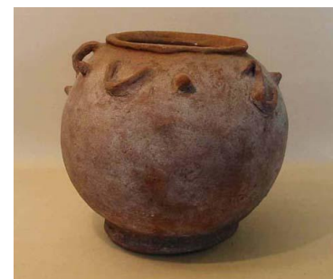
Aardenwerken bewaarpot uit Kayu Batu (collectie Papua Erfgoed)