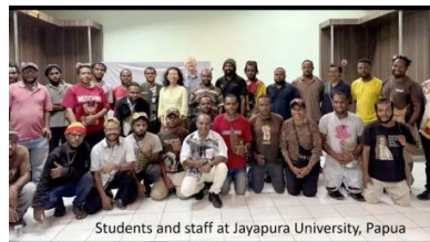
Doelgroep voor de repatriëring

Kortom er ligt het nodige aan huiswerk voor de vrijwilligers van onze stichting te wachten.