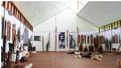
Zaal in het Asmat Museum

Een tweede Asmat-museum, het American Museum of Asmat Art, dat in 1995 werd geopend aan de Universiteit van St. Thomas in St. Paul , Minnesota door de initiatiefnemer in Agats, is te zien als een soort dependance. Het museum in Agats wordt gerund door en is eigendom van het Agats-Asmat Rooms-katholieke diocese en beperkt zich tot kunst uit de eigen regio.