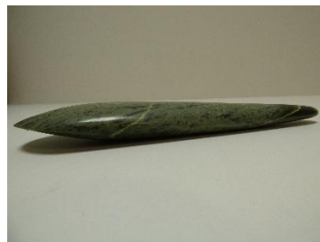
Groene bijsteen (collectie Zendingserfgoed)

Tjabo vertrok samen met zijn hond Apu naar Sentani, maar daar hielpen ze hem niet. Toen ging hij naar Ormu, waar hij Sirwai ontmoette (de Sirwai is een zeer belangrijke mannelijke vooroudernaam aan de hele noordkust van Dafonsoro. Zijn vrouwelijke tegenhanger wordt Sirmén genoemd). Sirwai was met zijn dorpingen stenen bijlen aan het maken (de stenen bijlen uit Ormu, groen van kleur, zijn in de hele regio bekend en zeer geliefd als bruidsprijs).