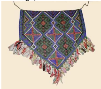
Danschort geelvinkbaai (collectie Papua Erfgoed)

Achter de zon vinden we bij hen allen nog een andere notie: die van de oude grootmoeder, uit wie alles voortkomt, de oermoeder/baarmoeder (gesymboliseerd door ringen - gemaakt van schelpen - die aan dansschorten en ceremoniële draagtassen worden bevestigd).