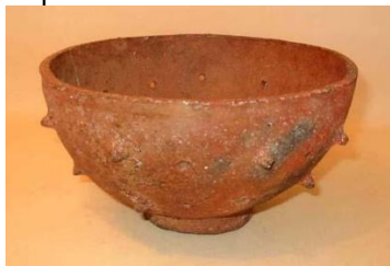
Aardenwerken pot uit Kayu Batu (collectie Papua Erfgoed)

Allemaal kennen ze verhalen, liederen en dansen over de zoon van de zon, bringer van vrede. Ze hadden conische culthuizen die ze overnamen van volken in het Sepikgebied in het oosten. Allemaal kennen ze verhalen en liederen over de oudere broer Depun (van Dafonsoro) en de jongere broer Kimani, verdreven door Depun, vertrokken naar het land van de voorouders in het westen, met medeneming van het geheim (= de "sleutel") van het leven. Verhalen over "de twee broers" (Depun&Kimani, Jubewi&Junon, Kuri&Pasai) nemen een belangrijke plaats in, in de mythologie van veel Papua-volken.