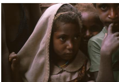
Portret van een meisje uit Wamena

Dat heeft een aantal schitterende beelden opgeleverd die de schoonheid van de natuur en de mensen recht doet. Jutka laat mensen poseren maar haar lens zoekt ook de hoofden van kinderen in de menigte.