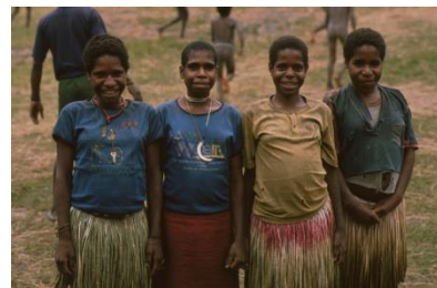
Vier vrouwen uit Wamena

Ook de fotogenieke plaatjes ontbreken niet. De beelden geven tevens een mooi zicht op het reizen in het Bergland. Ook al is het ruim dertig jaar geleden, de politiecontroles en de benodigde toestemming om verder te reizen bestaan nog steeds en zijn steeds strenger tot onmogelijk geworden.