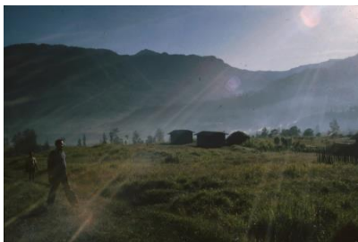
Huisjes in het Wisselmeren-gebied

Voor mensen, zoals ik, die niet in het Centrale Bergland zijn geweest is deze fotoserie uit 1989 een aanrader. Jutka maakt veelvuldig gebruik van een groothoeklens waarmee de bewoners van de Baliemvallei en het Wisselmerengebied in hun natuurlijke omgeving worden afgebeeld.