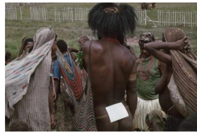
Kleurige 'nokens' of nettassen

Het leven overdag en in de avond wordt door haar vastgelegd. Dat levert ook af en toe een intiem portret op wanneer zij bijvoorbeeld een man uit de Baliemvallei fotografeert die een armband vlecht. Zie de website Multimedia: BD_166_205 t/m 207.