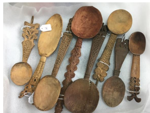
Motieven van de Hattam op een rij: herhaling, spiegeling en verschuiving van het spiraalmotief maken het verschil in patronen.