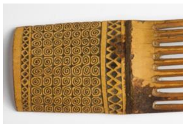
De greep van een haarkam met ruit en spiraalmotieven.