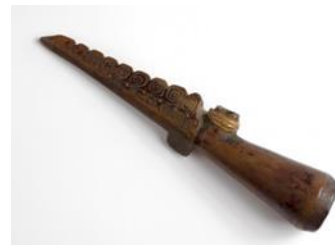
Versierd handvat van een pijp.

Door het gebruik van verschillende symmetrie ontstaan er telkens andere patronen.