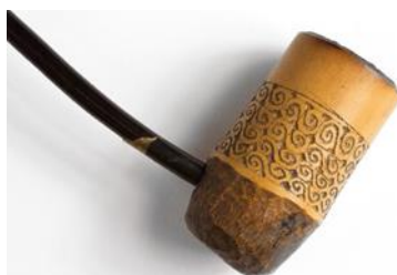
Een pijpenkop met een uitgesneden motief van herhaalde gespiegelde spiralen.

De houten en bamboe voorwerpen uit Hattam zijn vaak versierd met dicht op elkaar uitgesneden spiraal- en ruitmotieven. Het ruitmotief is op zichzelf staand maar ook te zien in het kruispunt van de spiralen.