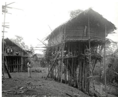
Huizen in Sjiagha

overtuigen dat ze met goede bedoelingen kwamen. Hun witte gezichten speelden hierbij zeker een positieve rol. Was het ijs eenmaal gebroken dan bleken de bewoners allervriendelijkst te zijn. In veel gesprekken kwam de behoefte aan vrede sterk naar voren, waarbij Meuwese dan aantekent dat vrede alleen mogelijk is door interventie van buitenaf: het bestuur.