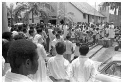
Bisschoppenconferentie in 1967 in Jayapura

https://www.flickr.com/photos/papuan_cultures/albums is een belangrijke site om te bezoeken, als u geïnteresseerd bent in Papua. De aantallen foto's die er gedigitaliseerd en al op te vinden zijn, zijn indrukwekkend en van groot historisch belang.